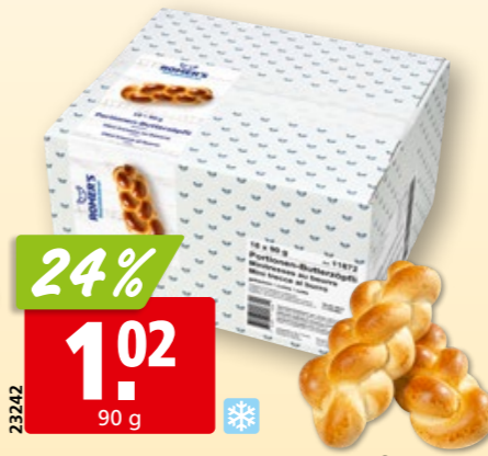
Romer's Portionen-Butterzöpfli tk, 18 x