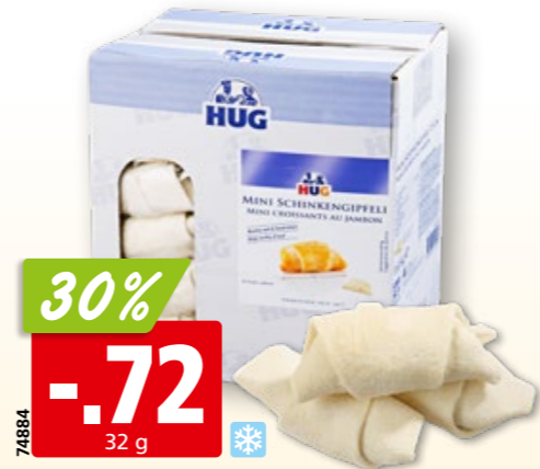
Hug Mini-Schinkengipfeli tk, 50 x