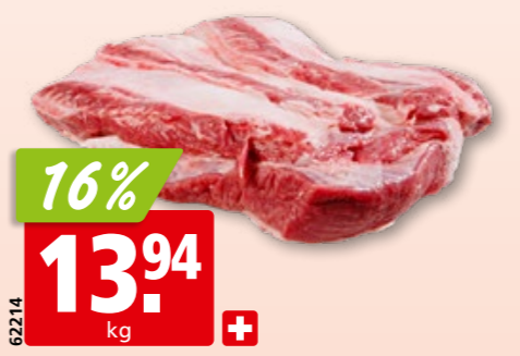
Rinds-Siedfleisch frisch durchzogen, aus der Schweiz