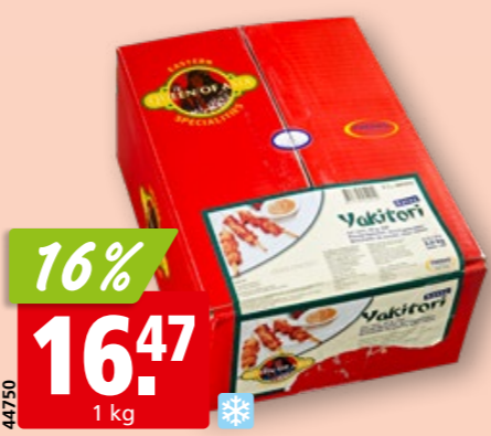
Yakitori-Spiessli Satay aus Thailand, tk, 2 x