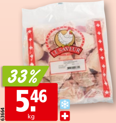
Poulet-Oberschenkel aus der Schweiz, tk, 2.5 kg