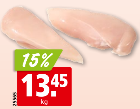
Henri IV Pouletschnitzel frisch kalibriert, aus Frankreich, ca. 2.5 kg