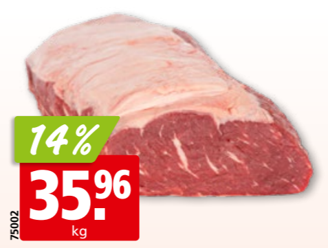
Rinds-Entrecôte frisch aus Australien