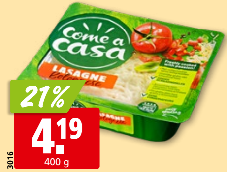
Come a casa Lasagne Bolognese