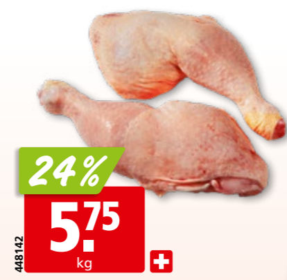
Pouletschenkel frisch aus der Schweiz, mit Rücken ca. 1.5 kg