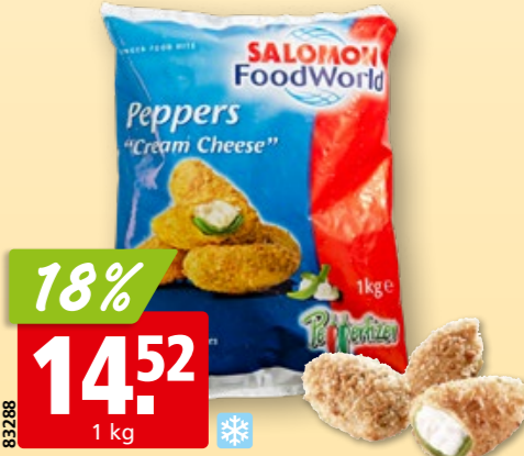
Salomon FoodWorld Jalapeños Peppers Cream Cheese 26-33 Stück, tk