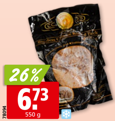
Ente gebraten aus China, tk