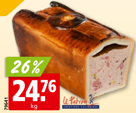
Le Patron Hauspastete 1/2, ca. 750 g