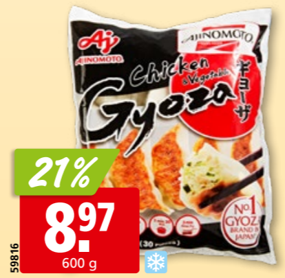
Ajinomoto Gyoza Potsticker Geflügel/Gemüse 30 Stück, tk