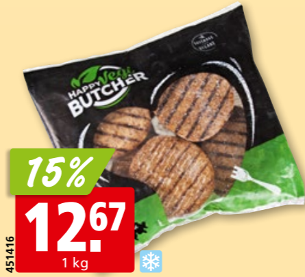
Happy Vegi Butcher Vegan Burgers tk