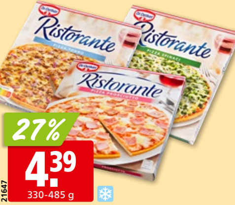
Dr. Oetker Pizza Ristorante diverse Sorten, tk