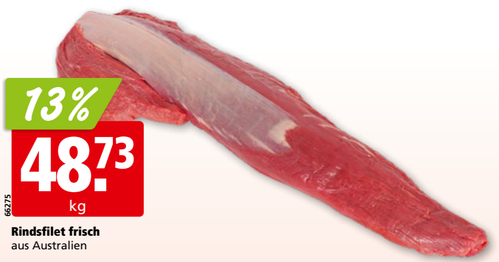
Rindsfilet frisch aus Australien