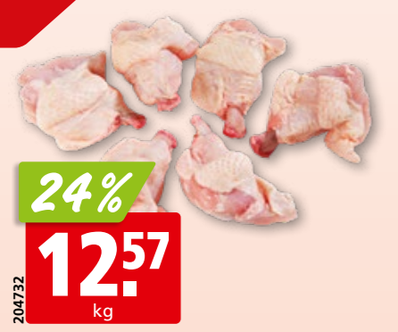
Henri IV Pouletsticks frisch aus Frankreich, ca. 1 kg