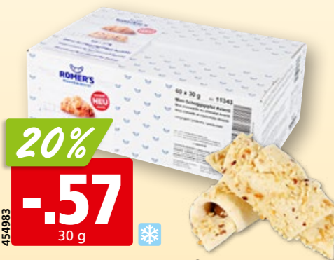
Avanti Mini-Schoggigipfeli tk, 60 x

20% auf gefüllte frische Pasta PASTIFICIO RIVETTI