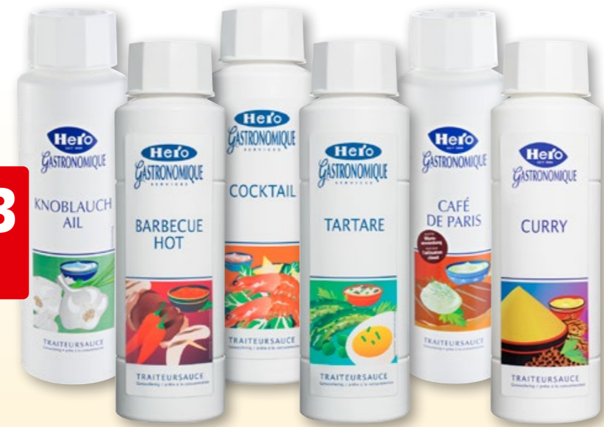
Hero Traiteursauce diverse Sorten