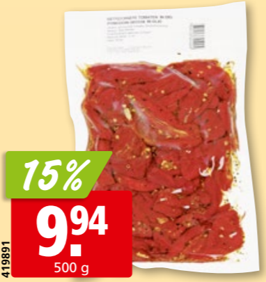
Ravalli getrocknete Tomaten in Sonnenblumenöl