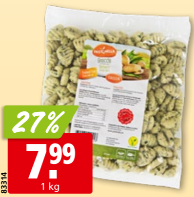
Pastinella Gnocchi mit Bärlauch