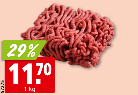
Rinds-Hackfleisch frisch, 8 mm aus der Schweiz/Österreich