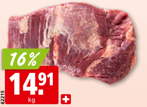
Rinds-Siedfleisch frisch mager vom Hals, aus der Schweiz