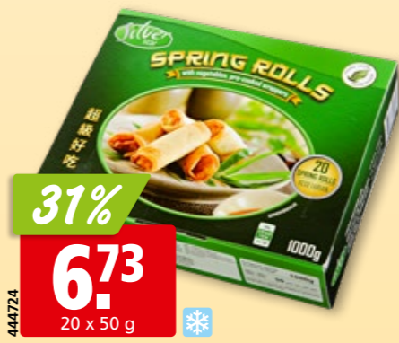
Silver Star Frühlingsrollen mit Gemüse tk