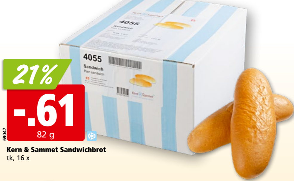
Kern & Sammet Sandwichbrot tk, 16 x