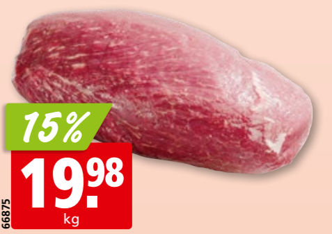
Rindsnuss Gastro frisch aus der Schweiz/Deutschland