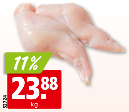
Kaninchenschenkel frisch mit Huft, aus Ungarn, ca. 1 kg