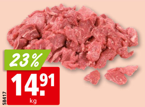
Rinds-Geschnetzeltes Gastro frisch zum Kochen aus der Schweiz/Deutschland/Österreich ca. 3 kg