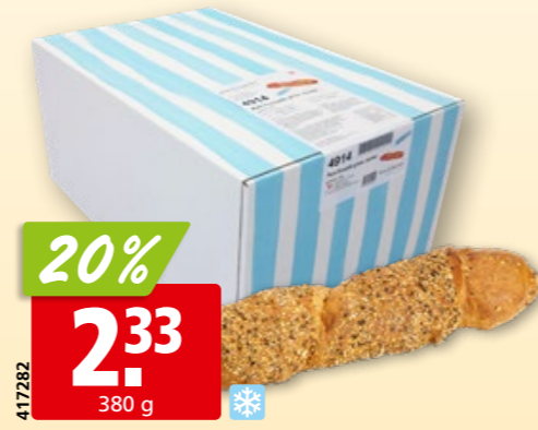
Kern & Sammet Pirouetten-Brot dunkel vorgebacken, tk, 18 x