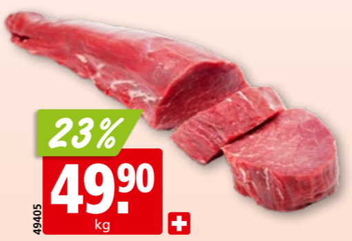
Rindsfilet frisch aus der Schweiz