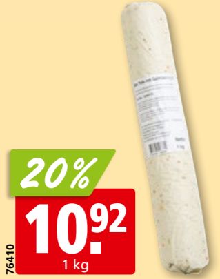
Tofu-Medaillons mit Gemüse Bio