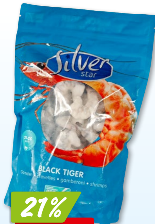
Silver Star Krevetten Black Tiger, 21-30 ASC, tk, 10 x