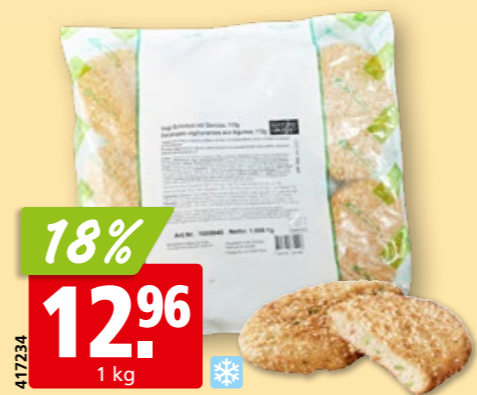
Nature Gourmet Vegi-Gemüseschnitzel, 112 g, 9 Stück, tk