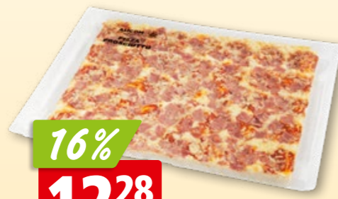
Pizza mit Schinken 40 x 30 cm