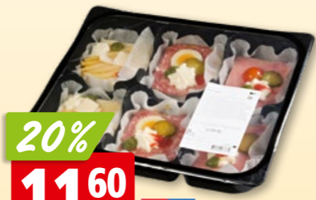
Rapelli Canapés gemischt