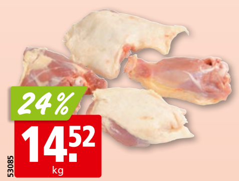
Henri IV Enten-Ragoût frisch mit Knochen, aus Frankreich, ca. 1.3 kg