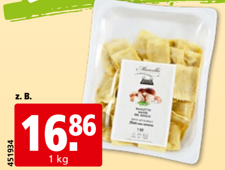
Bauletto Magie del Bosco diverse Sorten