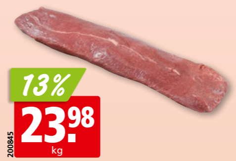
Rinds-Entrecôte Gastro frisch enthäutet, aus der Schweiz/Deutschland/ Österreich