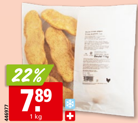
Poulet-Crispy, 100 g gegart, aus der Schweiz, tk