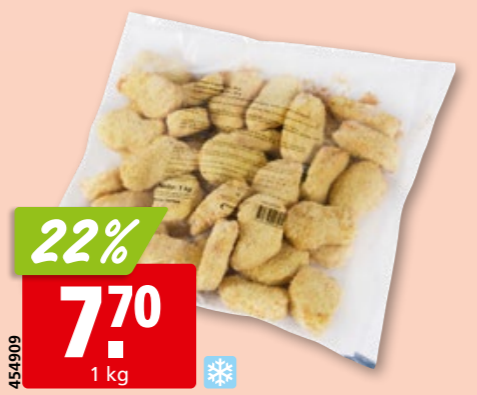
Poulet Nuggets, 25g aus Brasilien, tk