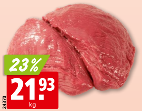
Rindshuft Gastro frisch pariert, aus der Schweiz/Deutschland/ Österreich