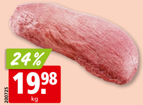
Rinds-Runder Mocken Gastro frisch enthäutet, aus der Schweiz/Deutschland/ Österreich